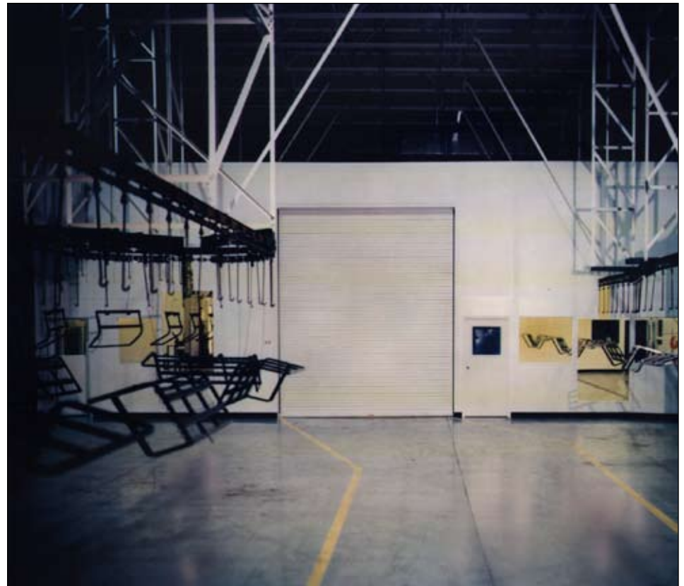
Las puertas de altura facilita el mantenimiento del sistema y provee acceso a montacargas.

Para más información de nuestro diseño, llame al 696-537-5555 o envíe un e-mail a info@portafab.com